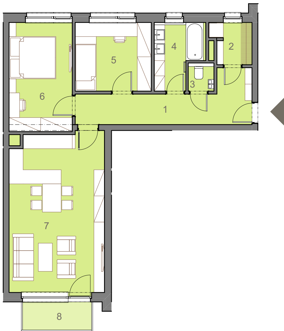
umístění jednotky v rámci podlaží a bytového domu