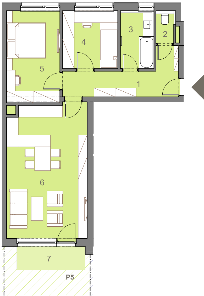
umístění jednotky v rámci podlaží a bytového domu