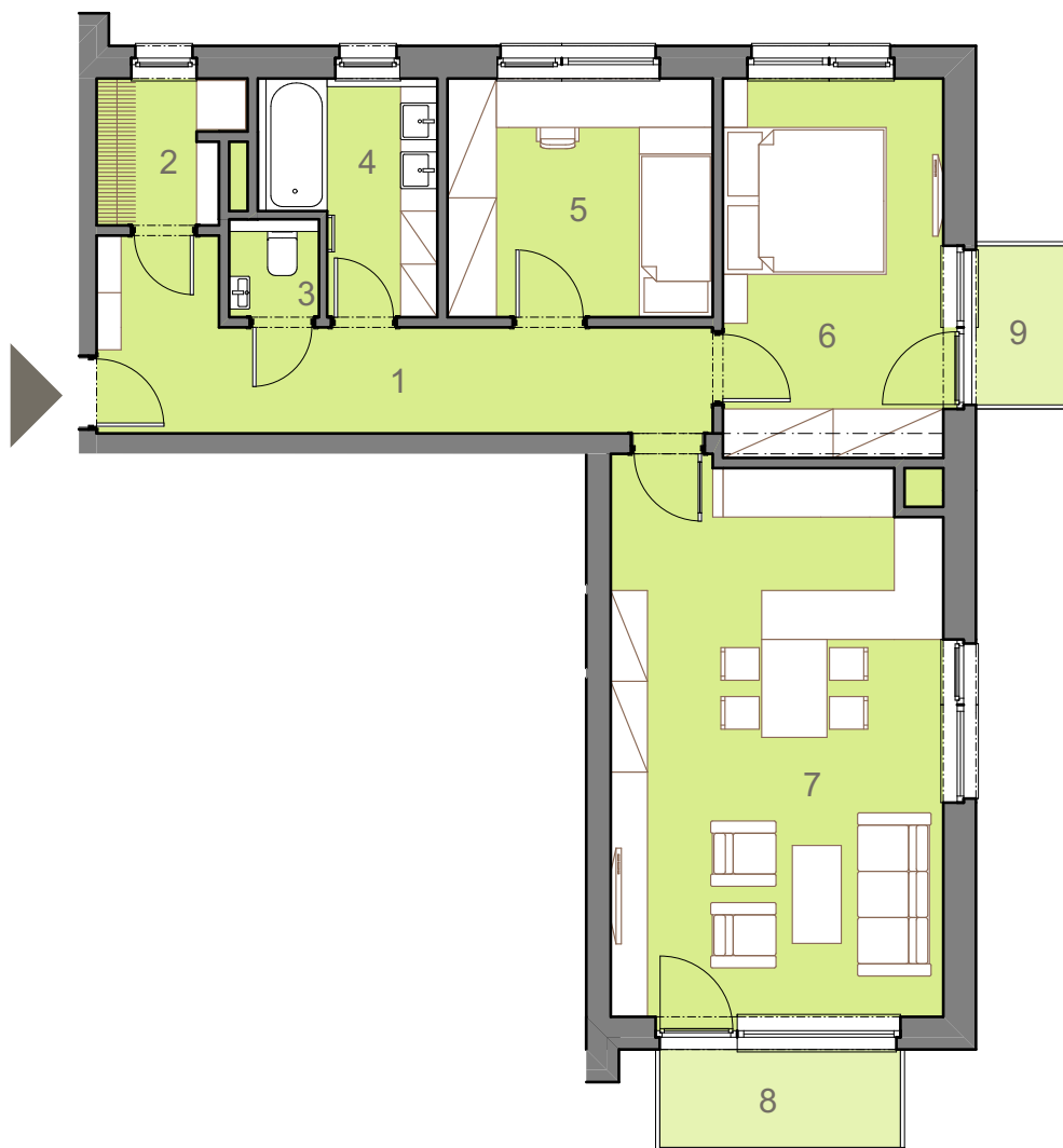
umístění jednotky v rámci podlaží a bytového domu