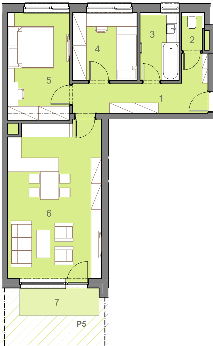
umístění jednotky v rámci podlaží a bytového domu