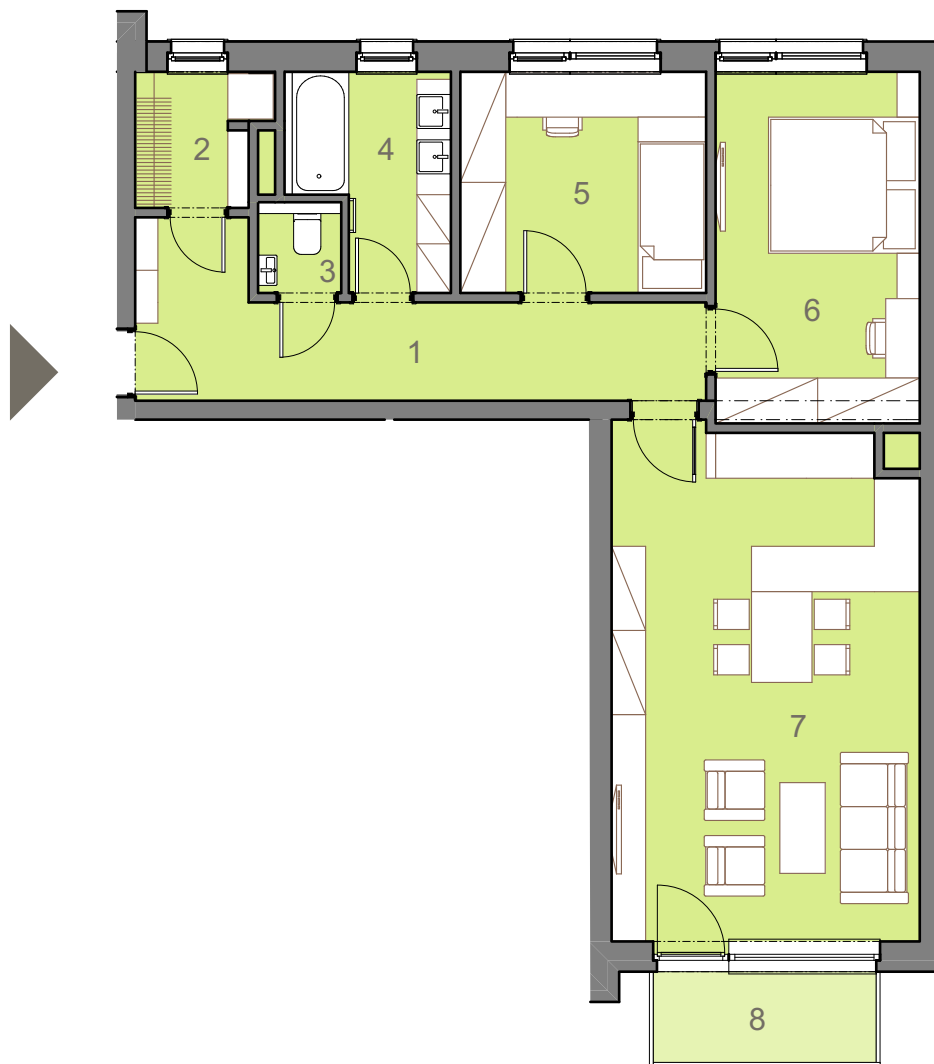
umístění jednotky v rámci podlaží a bytového domu